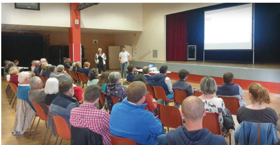
Troisième rencontre collective - 28 avril 2022