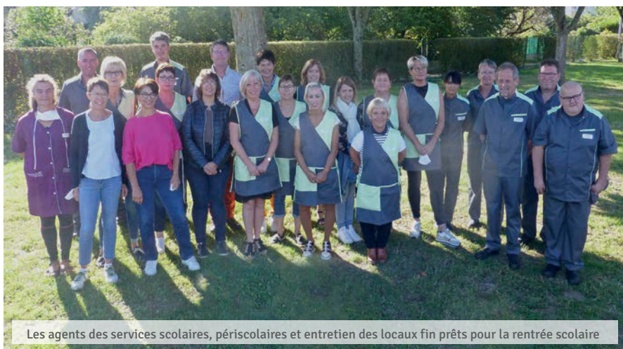
Les agents des services scolaires, périscolaires et entretien des locaux fin prêts pour la rentrée scolaire

Ainsi, dans toutes les salles des cartons « kits Covid » sont laissés à disposition des associations utilisatrices (suivant les termes des conventions établies). Ils contiennent : un spray détergent virucide, une bobine d'essuie-tout, un rouleau de sacs poubelle 10 litres et un flacon de gel hydroalcoolique.