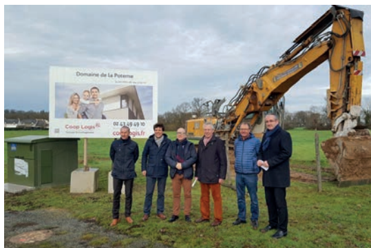
« Les représentants de la ville de Craon et de Coop Logis devant le futur quartier de la Poterne »